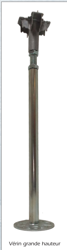
Vérin grande hauteur