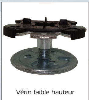
Vérin faible hauteur