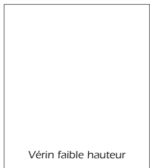
Vérin faible hauteur